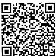
พระบรมฉายาลักษณ์