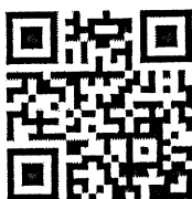
มติคณะรัฐมนตรี (๓ ก.ค. ๖๑)